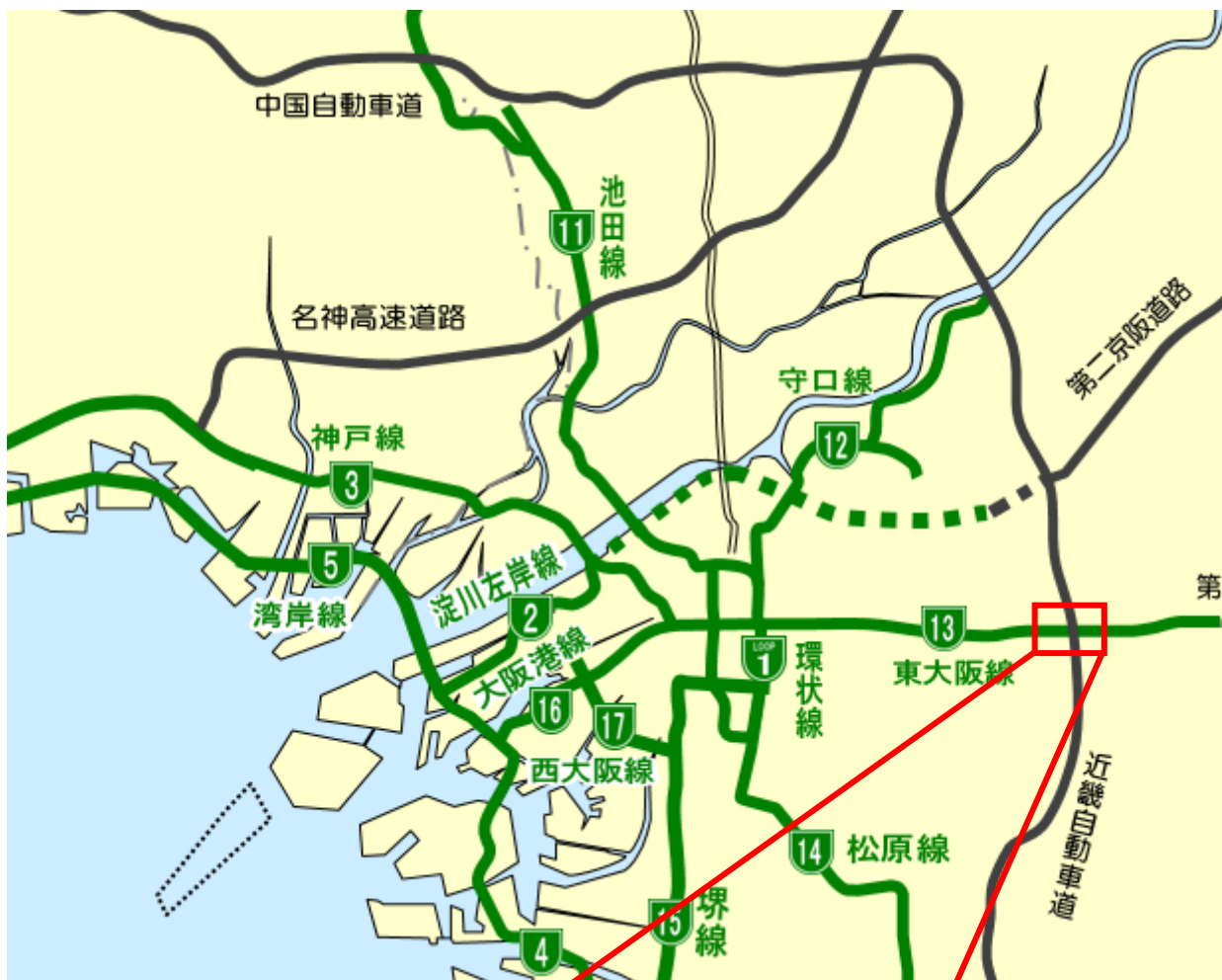
東大阪荒本入口料金所